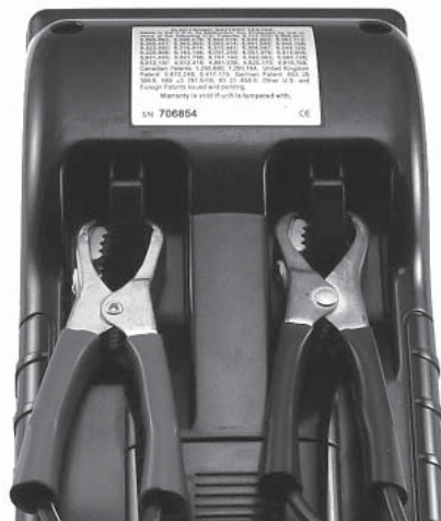
Etiquette du numéro de série

Des fixations se trouvent à l'arrière du testeur pour attacher les pinces lorsque vous ne les utilisez pas.